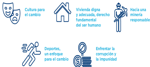
Ilustración 3. Políticas prioritarias apoyadas indirectamente por las iniciativas de cooperación internacional