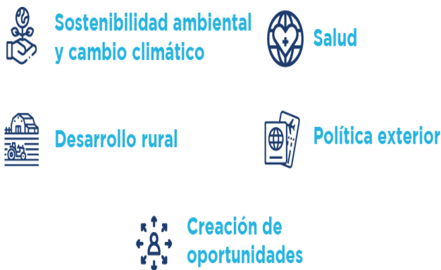
Ilustración 2. Top 5 de las áreas de política prioritaria más apoyadas por las iniciativas de CI.