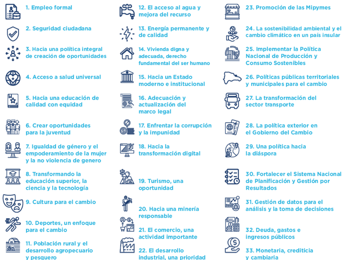
Ilustración 1. Políticas prioritarias establecidas en los lineamientos estratégicos para la formulación del PNPSP 2021-2024

Fuente: Elaboración de la DACCI con información de los lineamientos estratégicos para la formulación del Plan Nacional Plurianual del Sector Público 2021-2024