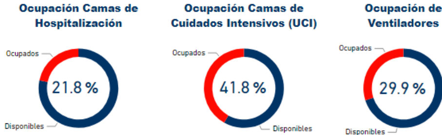
Fuente: Tablero de seguimiento COVID-19, página 2.