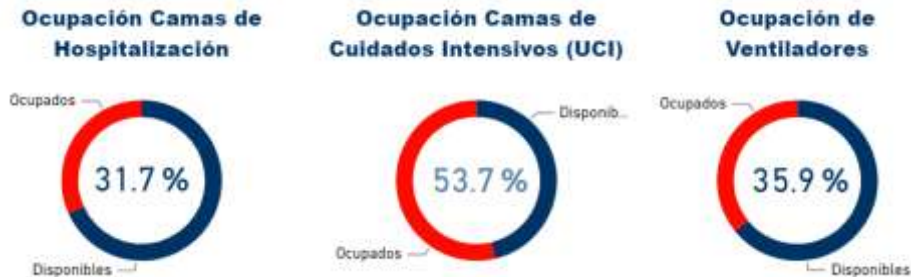
Fuente: Tablero de seguimiento COVID-19, página 2.