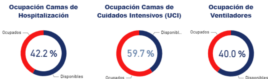
Fuente: Tablero de seguimiento COVID-19, página 2.