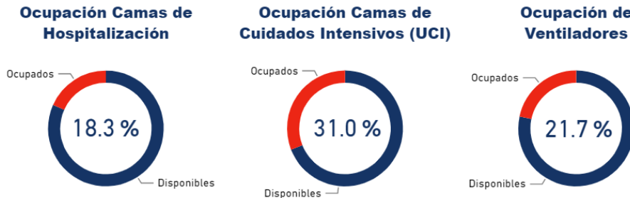
Fuente: Tablero de seguimiento COVID-19, página 2.