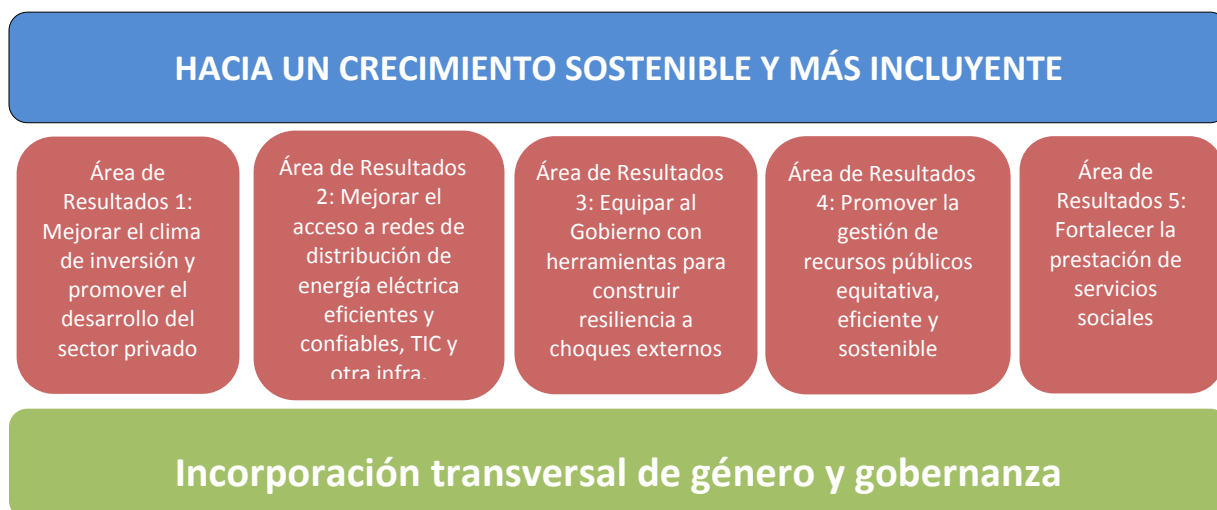
CUADRO 2: PROGRAMA DE FINANCIAMIENTO PROPUESTO POR EL BANCO PARA EL AF15-16