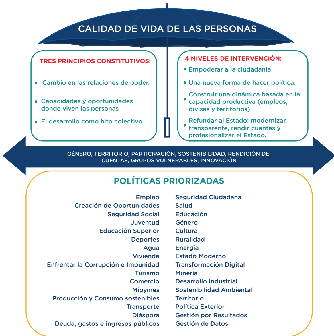
Ilustración 3. Propuesta esquemática modelo Calidad de Vida de las Personas