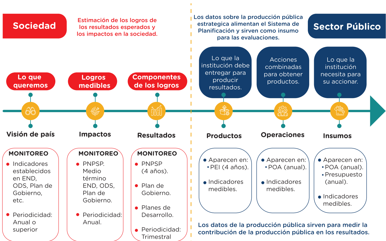
Ilustración 2. Monitoreo de la Cadena de Valor del Sector Público