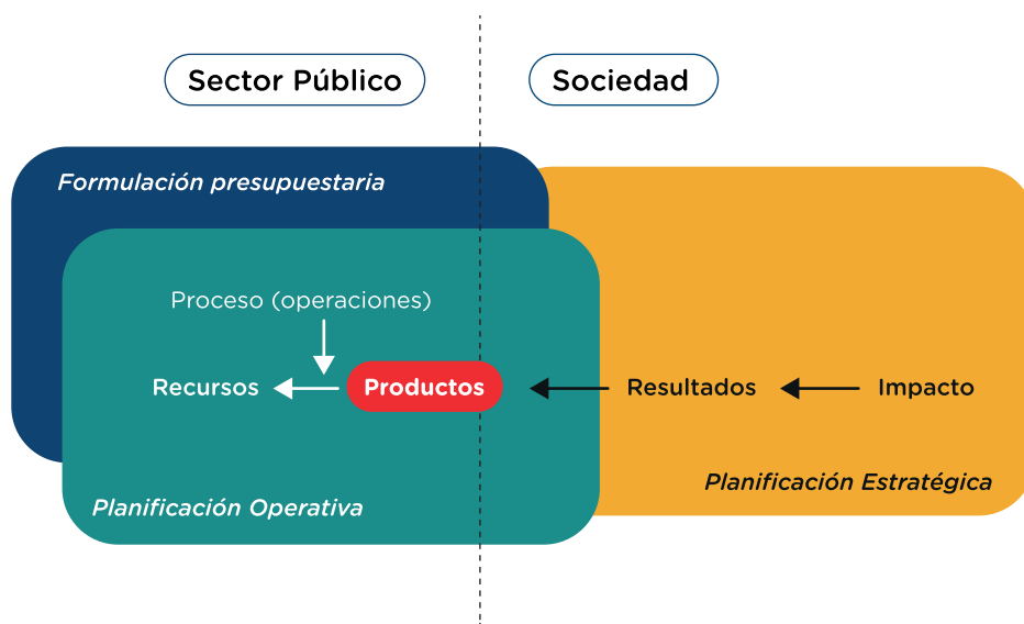
Ilustración 1. Esquema de lógica del esquema Cadena de Valor Público