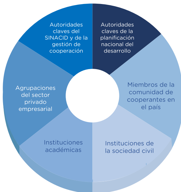
Ilustración 1. Actores claves considerados en grupos de discusión