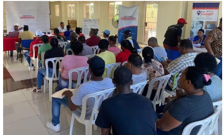
Nota: entrega de currículos en Pedernales.

La segunda feria se realizó en conjunto con el Consorcio ASCH NU encargados de la construcción de las obras de infraestructura hidrosanitarias. Las vacantes se enfocan en áreas de ingeniería, calidad, seguridad, medio ambiente, topografía, choferes y otras áreas de la construcción.