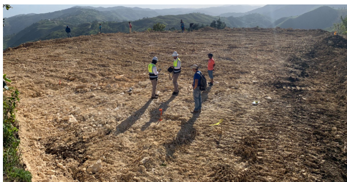
Adecuación terrenos donde se instalarán los paneles solares.

Esta comunidad, se encuentra a más de 1,200 metros de altura sobre el nivel del mar y a 23.8 km del municipio de la Descubierta. El punto más cercano a la red eléctrica está a 13 km, en la comunidad de Los Pinos del Edén; sin embargo, la condición montañosa de Sabana Real dificulta llevar la red eléctrica desde este punto, por lo que, la alternativa para suplir este servicio ha sido la construcción de una microrred aislada utilizando energía fotovoltaica, 100% renovable. La disponibilidad de energía permitirá instalar el alumbrado público en la comunidad, accesos a servicios de internet y contribuir a mejorar la calidad de vida de las personas, facilitando las actividades domésticas, productivas, comerciales, y educativas.