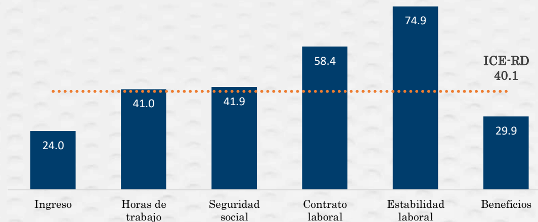
Índice de calidad del empleo de República Dominicana, por componentes, promedio 2016-2023 (puntos)

Fuente: Elaboración propia con microdatos de la ENCFT del BCRD.